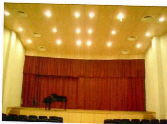
2 pav. Mažoji salė