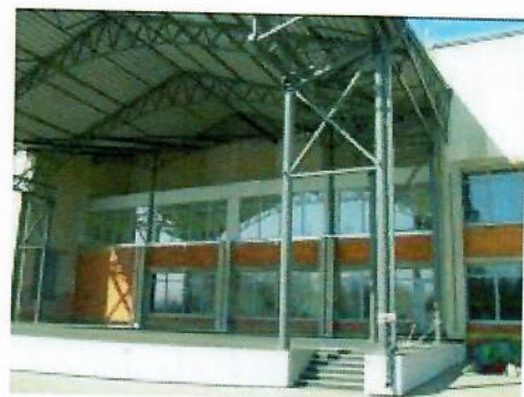
7 ir 8 pav. Įstaigos amfiteatras