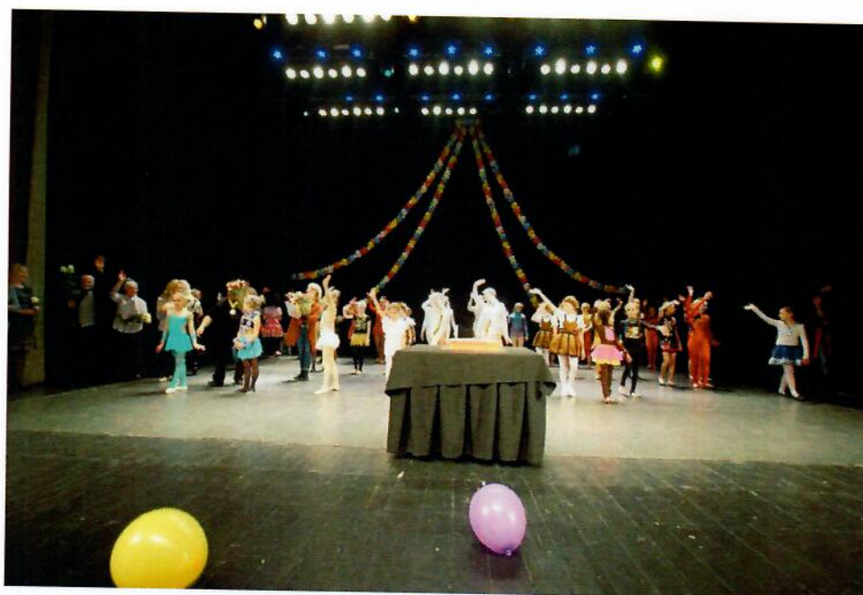
16 pav. Cirko festivalio akimirka

Gruodžio mėnesį įstaiga organizavo tarptautinį Alytaus cirko festivalį bei kartu šventė cirko „Dzūkija“ 35-ąjį gimtadienį. Šventinėje programoje pasirodė cirko artistai iš Lietuvos ir Latvijos.