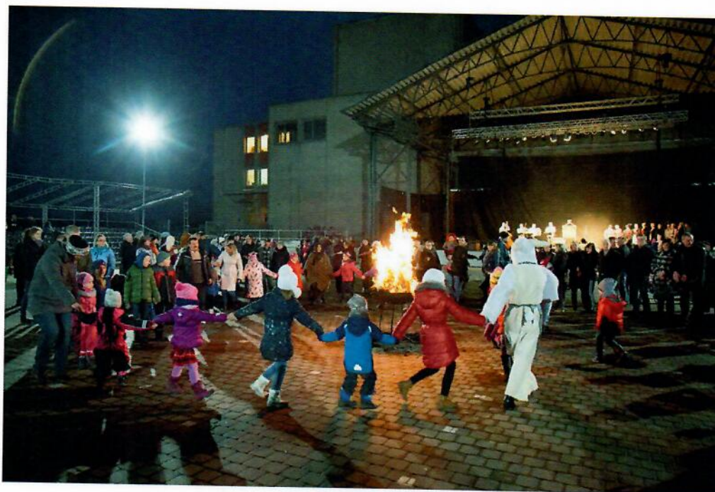
12 pav. Užgavėnių akimirka

Vasario mėnesį įstaiga organizavo Užgavėnių šventę, kurioje pasirodė folkloro ansamblis „Žvangucis“, teatro studija „Apartė“, liaudies dainų ir šokių ansamblis „Dainava“ ir šokių studija „Dosado“.