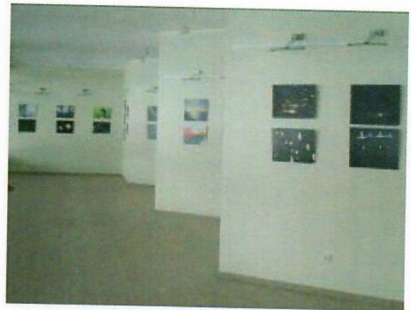
5 ir 6 pav. Naujoji parodų salė

2013 m. buvo baigtas statyti ir atidarytas įstaigos amfiteatras. Ši lauko scena yra skirta ir pritaikyta įvairiems koncertams ar kitiems renginiams šiltuoju metų laiku. Amfiteatro stogeliais dengtos tribūnos talpina iki 1000 žiūrovų. 24 m scena įrengta su vietine apšvietimo ir įgarsinimo aparatūra.