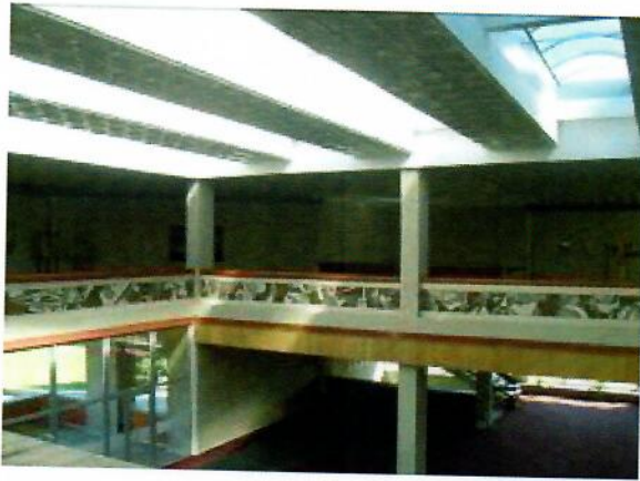
3 pav. II ir III aukštų vestibuliai