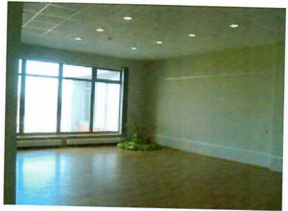
4 pav. Parodų salė

2012 m. vykdant lauko amfiteatro statybas, II aukšte buvo įrengta nauja parodų salė. Didelė ir šviesi naujoji erdvė puikiai tinka organizuoti fotografijos, tautodailės parodas bei ekspozicijas.