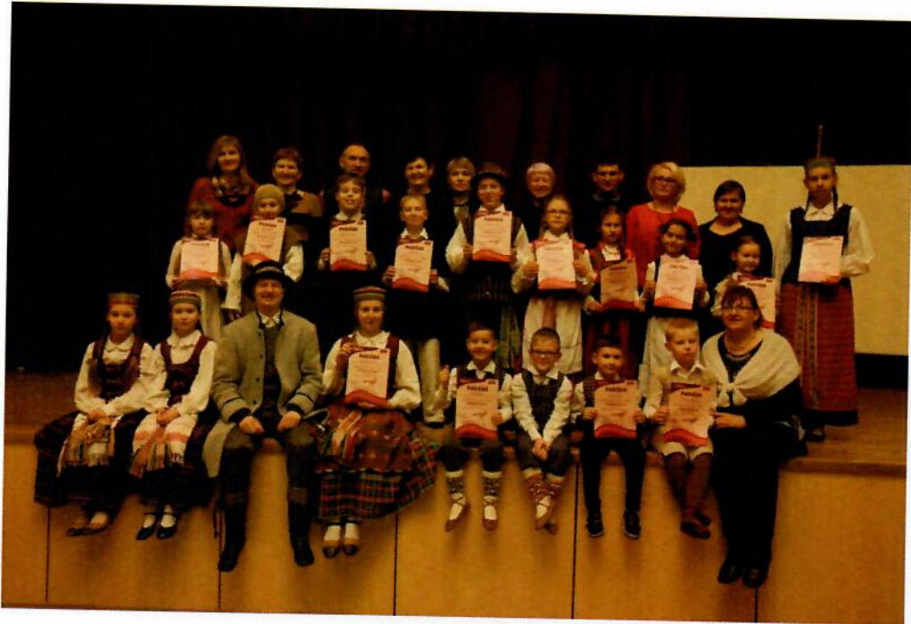
13 pav. Konkurso „Tramtatulis“ dalyviai

konkurso „Tramtatulis 2017“ vietinį turą. Jo metu Dzūkijos regiono kūrybą pristatė vaikai ir moksleiviai iš Alytaus miesto ir rajono.