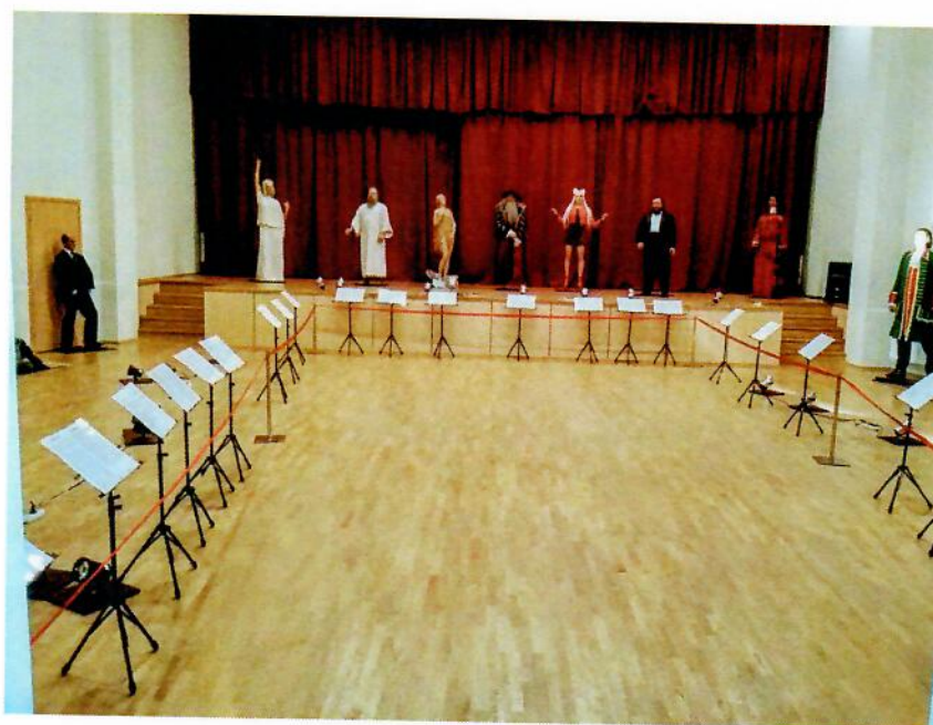
11 pav. Vaškinių figūrų paroda

Įstaigoje buvo surengtos 6 profesionaliojo meno parodos: Vaclovo Strauko fotografijų paroda „Paskutinis skambutis“, paroda „Aplink pasaulį – savo noru“, vaškinių figūrų paroda iš Sankt Peterburgo, plakatų paroda „Istorijų įvairovė plakatuose“. Įstaigoje vyko 2 1-ojo tarptautinio Alytaus fotografijos festivalio „Alytus foto 2017“ parodos: fotomenininko Aleksandro Ostašenkovo paroda „Būsenos“ ir Sauliaus Saladūno paroda „Kūnai“.