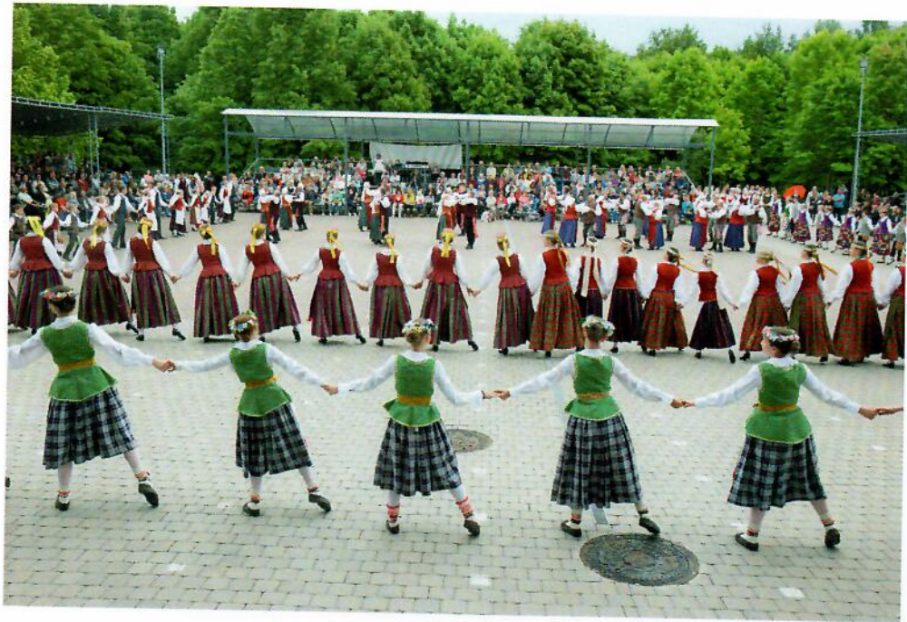
14 pav. Dzūkų šventės akimirka

Rugsėjo mėnesį įstaigoje vyko jau tradicine tapusi Lietuvos liaudies kultūros centro inicijuota akcija „Visa Lietuva šoka“. Renginio metu lankytojai buvo mokomi tradicinių dainų ir šokių, o koncertinėje programoje pasirodė folkloro ansamblis „Žvangucis“.