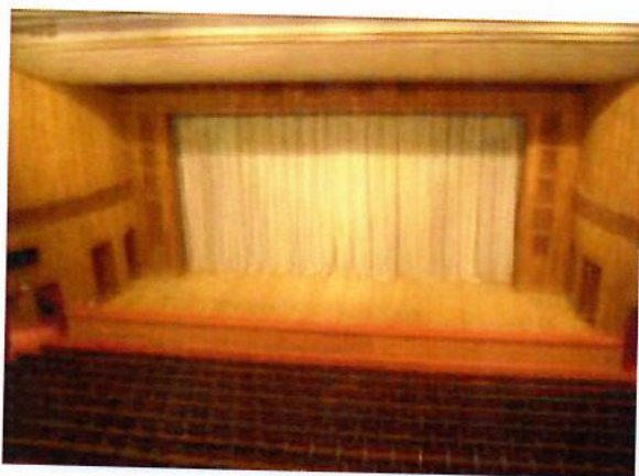
1 pav. Didžioji salė

Įstaigoje yra 740 stacionarių vietų, iš viso apie tūkstantį žiūrovų talpinanti, tarp Lietuvos estrados atlikėjų ir teatrų populiari didžioji salė. Mažoji salė, kurioje telpa apie 200 žiūrovų, yra pritaikyta mažesniems, kameriniams renginiams. Įstaigoje yra daug erdvių, kurios puikiai tinka organizuoti vaizduojamojo meno parodas.