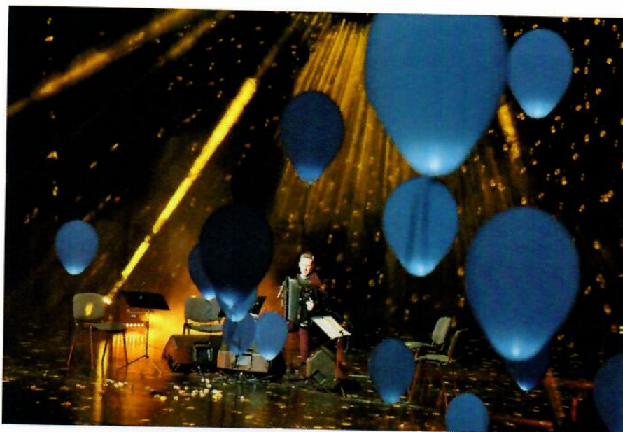
15 pav. Akimirka iš renginio „Metų apdovanojimai 2017“

visuomeninę veiklą, miesto vardo garsinimą ir šventinės aplinkos kūrimą. Vakaro programą vainikavo akordeono virtuozas Martynas Levickis.