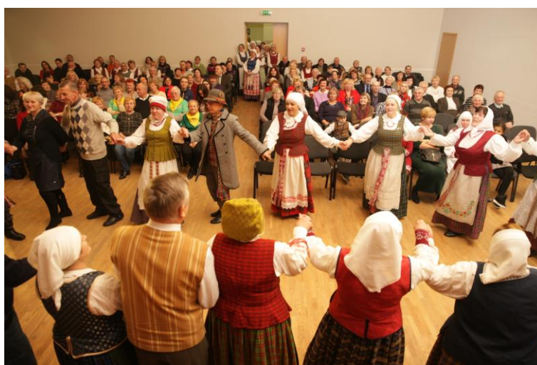
15 pav. Šv. Cecilijos dienai paminėti skirtos vakaronės akimirka

Lapkričių buvo organizuota vakaronė šv. Cecilijos dienai paminėti, kurioje dalyvavo folkloro ansamblis „Žvangucis“, Varėnos kultūros centro ansamblis „Žeiria“ ir Marcinkonių kaimo etnografinis ansamblis. Vakaronėje apsilankė apie 200 žiūrovų.