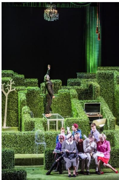
12 ir 13 pav. Lietuvos nacionalinio dramos teatro spektaklių „Katedra“ ir „Tartiufas“ akimirkos