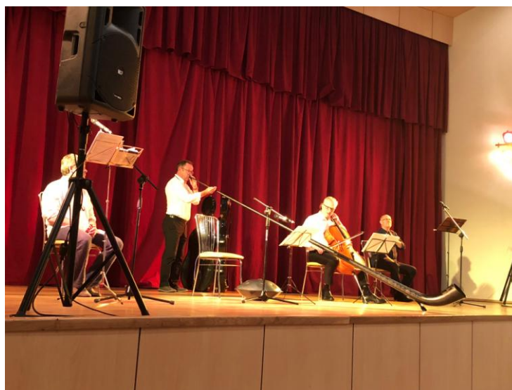
11 pav. „Dainavos šalies muzikos festivalio“ koncertas „Virility. Keturių žaidimas“

Buvo vykdomas projektas „Profesionaliosios muzikos koncertų sezonas Alytaus mieste“, kurį finansavo Lietuvos kultūros taryba. Profesionalaus meno sklaida regionuose daro įtaką visuomenės kultūros lygio augimui, prisideda prie Lietuvos regioninės kultūros politikos realizavimo, atskirties tarp didžiųjų miestų ir regionų kultūrinio gyvenimo mažinimo. Šio projekto finansavimas suteikė galimybę daryti nuolaidas koncertų bilietams, kuriuos įsigijo pensininkai, studentai, moksleiviai, neįgalieji ir socialiai remtini asmenys. Įgyvendinant projektą, buvo suorganizuoti 3 koncertai.