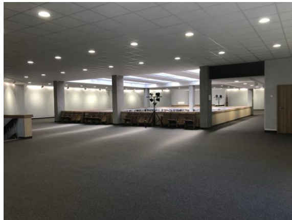
5 ir 6 pav. Trečio aukšto vestibulio erdvė parodoms