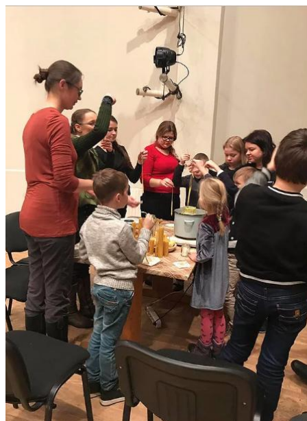
20 ir 21 pav. Advento vainiko pynimo ir žvakių liejimo kūrybinės dirbtuvės

Gruodžio mėnesį įstaiga organizavo Alytaus cirko festivalį „Cirko stebuklas“. Šventinėje programoje pasirodė Alytaus cirko studija „Dzūkija“, Šakių cirko studija „Šypsena“, profesionalaus cirko „Amber“ artistai. Sulaukėme apie 300 žiūrovų.