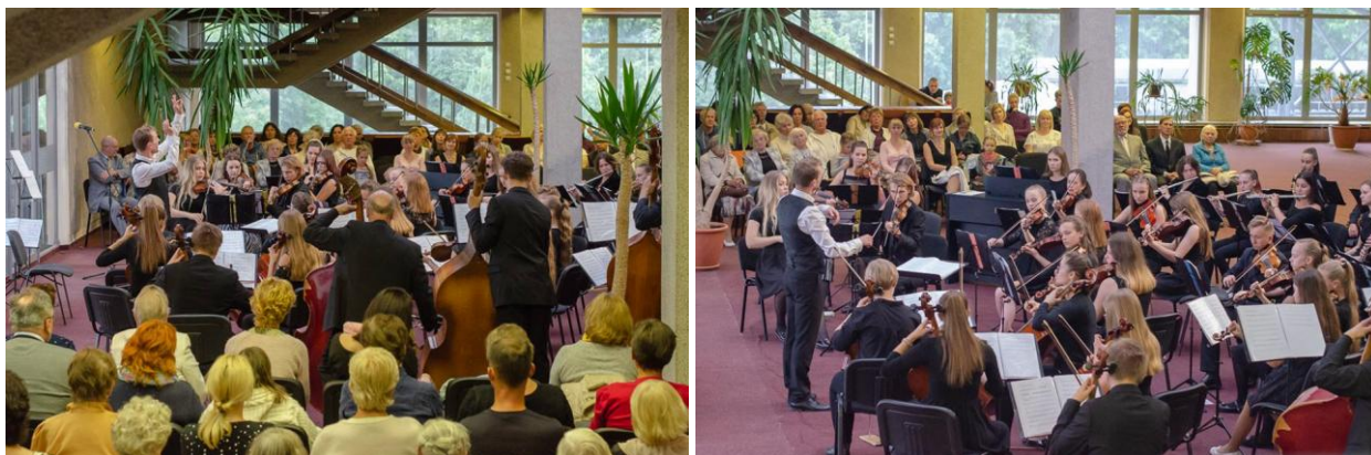
9 ir 10 pav. Dainavos šalies muzikos festivalio koncertas Alytaus kultūros ir komunikacijos centre

2018 m. Alytaus kultūros ir komunikacijos centre buvo suorganizuota 14 profesionaliosios muzikos koncertų. Buvo suorganizuotas 17-asis tarptautinis Dainavos šalies muzikos festivalis, kurio tikslu tapo siekis mažinti skirtumus tarp regiono ir didžiųjų miestų kultūrinio gyvenimo, formuoti Alytaus miesto ir Dzūkijos regiono kultūrinės tradicijas. Festivalio metu vyko 8 koncertai: 5 iš jų Alytaus kultūros ir komunikacijos centre, 1 Alytaus Šv. Kazimiero bažnyčioje, 1 Šv. Jurgio bažnyčioje (Lazdijų raj.) ir 1 Miroslavo Švč. Trejybės bažnyčioje (Alytaus raj.). Festivalį finansavo Lietuvos kultūros taryba ir Alytaus miesto savivaldybė.