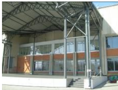
3 ir 4 pav. Įstaigos amfiteatras