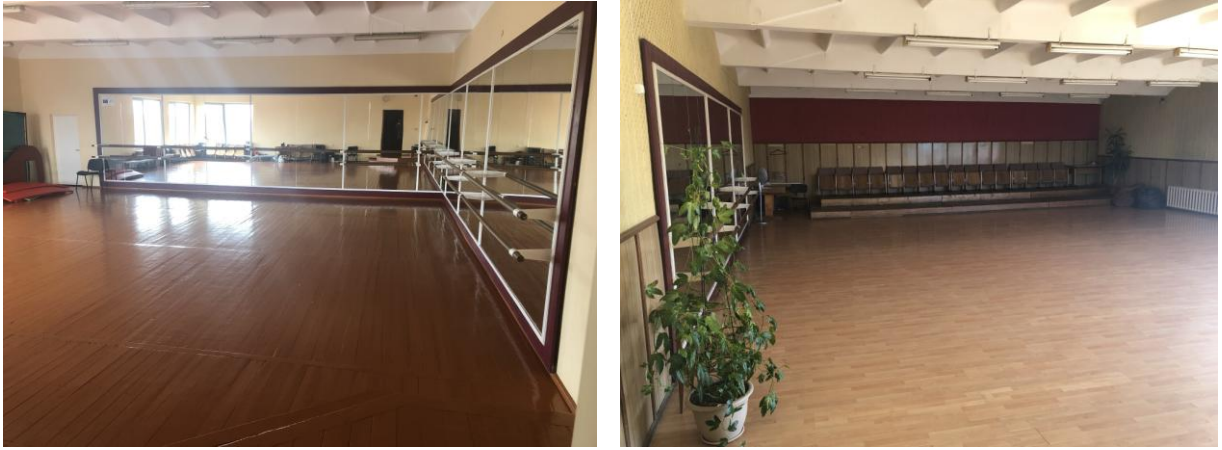
7 ir 8 pav. Mažoji ir didžioji baletų salės

2018 m. Alytaus miesto savivaldybės administracija įgyvendino VšĮ Alytaus kultūros ir komunikacijos centro pastato rekonstravimo projektą – buvo atliktas AKKC Didžiosios salės kapitalinis remontas, nupirktos ir sumontuotos naujos žiūrovų kėdės ir LED ekranas.