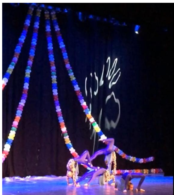
22 pav. Cirko festivalio akimirka

Gruodžio mėnesį įstaiga organizavo Alytaus cirko festivalį „Cirko stebuklas“. Šventinėje programoje pasirodė Alytaus cirko studija „Dzūkija“, Šakių cirko studija „Šypsena“, profesionalaus cirko „Amber“ artistai. Sulaukėme apie 300 žiūrovų.