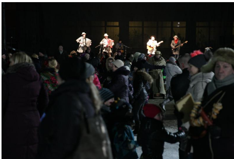
14 pav. Užgavėnių akimirka

Renginio dalyviai buvo vaišinami blynais, kuriuos kepė Alytaus profesinio rengimo centro mokiniai, o arbatą virė Alytaus miesto bendruomenės centras. Ši šventė organizuojama kiekvienais metais, todėl miestelėnai ją jau gerai išsidėmėjo. Šventei netrukdo net ir šaltas oras – kasmet sulaukiame vis daugiau lankytojų.