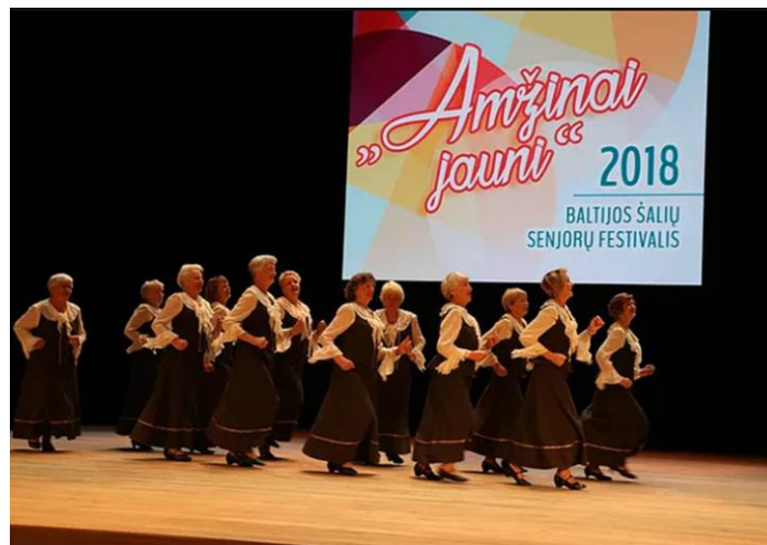
19 pav. Baltijos šalių senjorų festivalio koncerto „Amžinai jauni“ akimirka