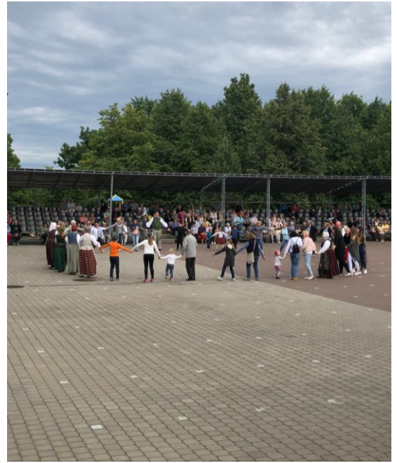
17 ir 18 pav. AKKC Joninių šventės akimirka