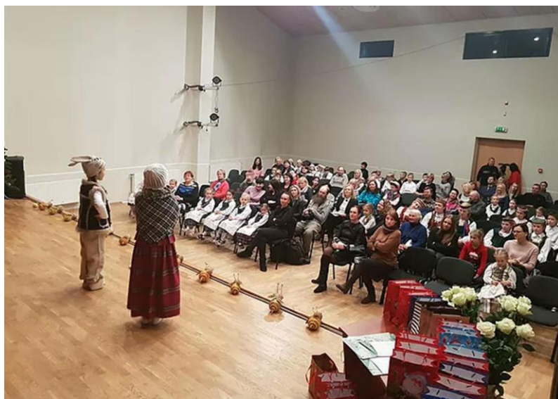
16 pav. Konkurso „Leliumoj“ akimirka

Lietuvių liaudies folkloras – tai vienas ryškiausių tautos bruožų. Jis formuoja vaikų tautinį mąstymą, etninę kultūrą, pasireiškiančią per tradicijas ir papročius. Konkurso apjungia dvi liaudies rūšys – dainuojamoji ir pasakojamoji. Konkurse skambėjo Kalėdų laikotarpio autentiškos giesmės ir dainos, buvo sekami tautosakos kūriniai – pasakos, sakmės, mįslės, anekdotai, prietarai. Konkurse apsilankė apie 200 žiūrovų.